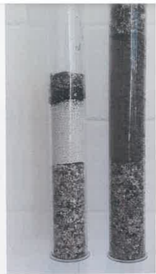
Versuchsaufbau in Anlehnung an Önorm B 2506-3 mit unterschiedlichen Substraten

spiel im menschlichen Organismus (Arge Nano 2018). Mikroplastikteile neigen außerdem dazu, dass sich gefährliche Stoffe, wie zum Beispiel PCB, DDT oder auch HCH, durch adsorptive Effekte an den Plastikoberflächen anlagern. Ändern sich nun die Milieubedingungen, zum Beispiel durch Aufnahme in den Verdauungstrakt, so können die zuvor angelagerten Stoffe wieder freigesetzt werden. Dabei entstehen um ein Vielfaches höhere Schadstoffkonzentrationen der Mikroplastikpartikel als im umgebenden Wasser. Darüber hinaus werden neben organischen Schadstoffen an Mikroplastikpartikeln auch höhere Gehalte an Metallen, wie Aluminium, Blei, Chrom, Kupfer und Zink, nachgewiesen. Im Vergleich mit natürlichen Sedimenten, die