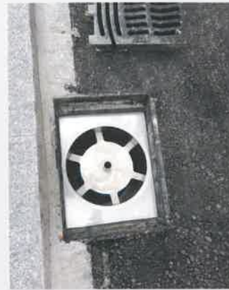
Enregis-Vivo-CRC-sorp, eingesetzt in einen Einlaufschacht