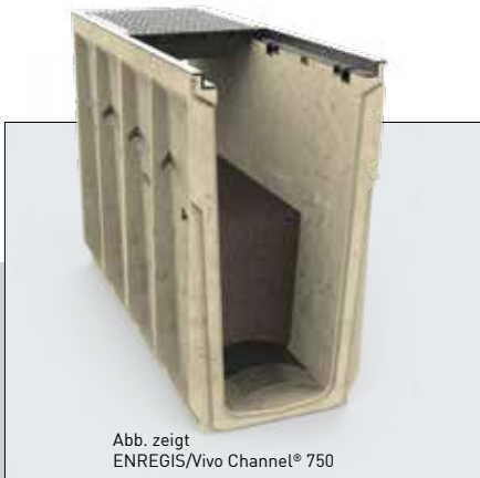
Abb. zeigt ENREGIS/Vivo Channel® 750

Die Reinigung und Behandlung organisch und anorganisch belasteter Niederschlagsabflüsse stellt eine zunehmend größere Herausforderung dar. Gerade im Bereich der Niederschlagswasserbehandlung von stark frequentierten Verkehrsflächen über die belebte Bodenzone / Mulde, stößt man bereits bei der Planung immer häufiger auf Probleme, die im Zusammenhang mit dem für die Mulde benötigten Flächenbedarf stehen. Häufig führen auch qualitativ unzureichend ausgeführte Muldensysteme dazu, dass Alternativen unumgänglich werden. Neben dem sehr erfolgreichen Konzept der unterirdischen ENREGIS®/Belebte Bodenzone hat sich in den letzten Jahren der Bedarf entwickelt, auch oberirdische Alternativen weiter in Betracht zu ziehen. Hier setzt das System ENREGIS/Vivo Channel® an. Das System stellt eine vollwertige, mit Substrattechnik ausgestattete und gleichzeitig inspizier- und spülbare Niederschlagswasserbehandlungsanlage zur Behandlung von mineralöhlhaltigen Niederschlagsabflüssen in Form einer Linienentwässerungsanlage als Alternative zur belebten Bodenzone / Mulde dar.