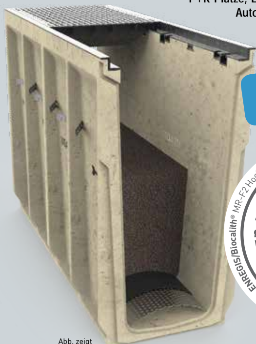
Abb. zeigt ENREGIS/Vivo Channel® 750